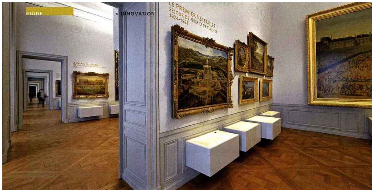
L'enfilade des anciens appartements des princes de sang distribue désormais onze salles dont les murs sont revêtus d'une résine synthétique d'un gris très léger.